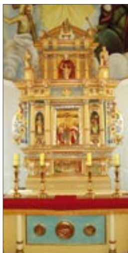
Ołtarz w Bobrówku z 1627 roku